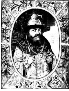
Царь Михаил Романов