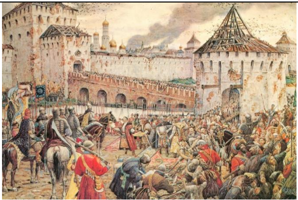
3. Э.Э. Лиснер «Изгнание польских интервентов из Московского кремля»