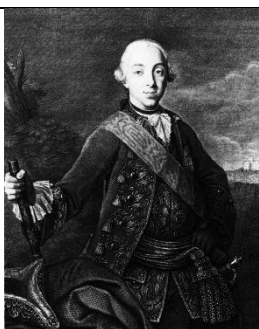
Император Петр III

2) Кто из представленных ниже исторических деятелей был современником государя, изображенного на картине? В ответе запишите две буквы.