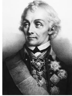
Александр Васильевич Суворов