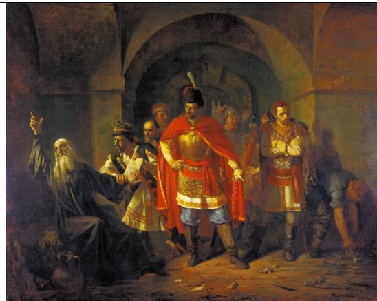
4. П.П. Чистяков «Патриарх Гермоген отказывается полякам подписать грамоту»

2. Прочитайте текст и ответьте на вопросы. 3 балла