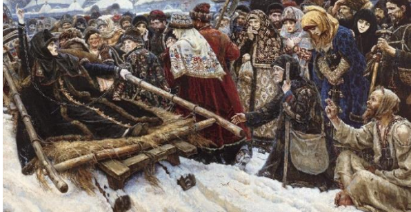
1. В.И. Суриков «Боярыня Морозова»

Б) Какие из произведений живописи, представленных ниже, отражают события, связанные с сюжетной линией указанной скульптуры? В ответе запишите две буквы, под которыми указаны эти произведения живописи. 2 балла