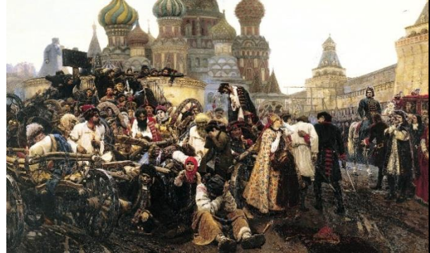
2. В.И. Суриков «Утро стрелецкой казни»